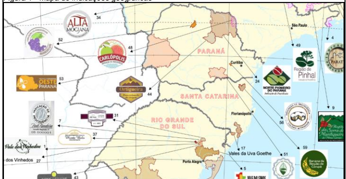
Figura 1 - Mapa de indicações geográficas