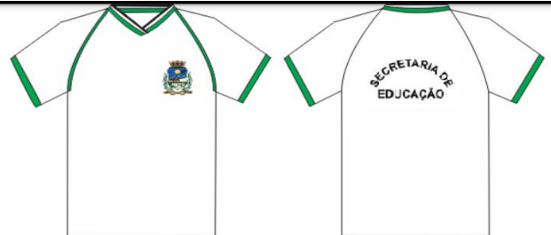
Detalhe da gola