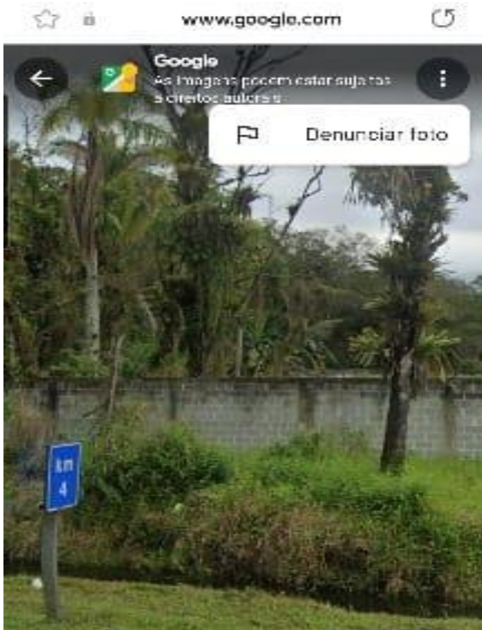
Imagem 2 - Imóvel alvo da controvérsia