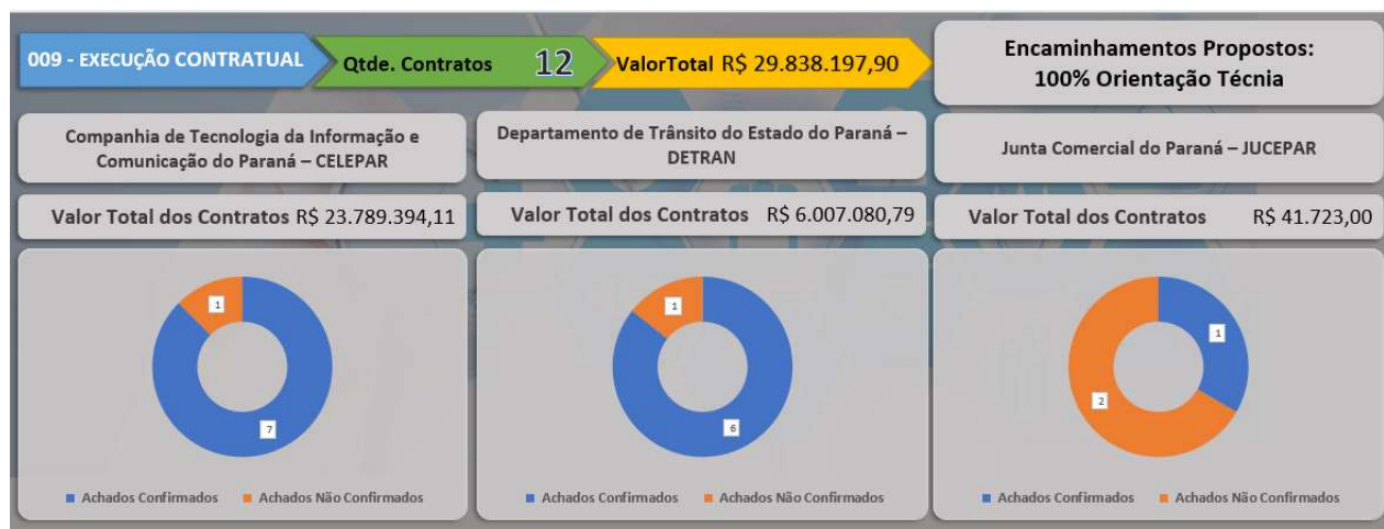
Figura 1 – Painel de Controle da Fiscalização

32. No todo, a fiscalização centrou-se no exame de 12 (doze) contratos administrativos que, juntos, somam o valor de R$ 29,8 milhões, tendo sido identificados 18 (achados), dos quais 14 (quatorze) foram confirmados após a manifestação inicial dos gestores, conforme se observa na figura a seguir: