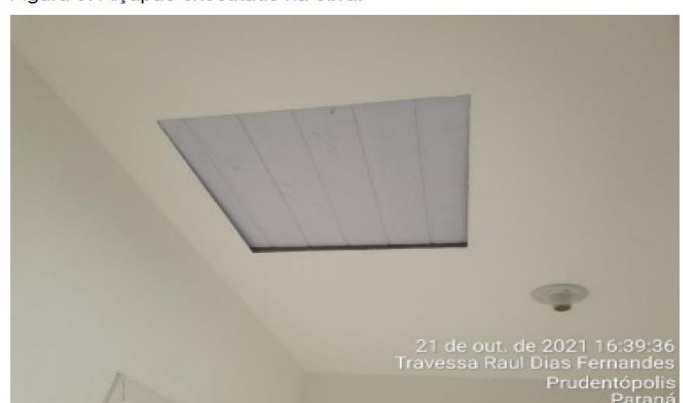
Figura 3: Alçapão executado na obra.