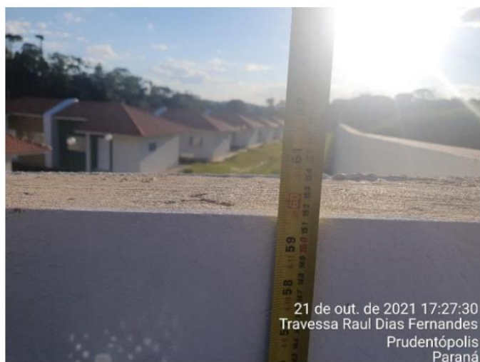
Figura 5: Imagem demonstrando a altura do muro de divisa.