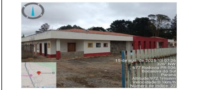
Foto frente a esquerda.

Nessa situação, cabia ao Município exigir da contratada a prestação da garantia destinada a resguardar a administração diante de eventual inadimplemento. Tal providência, contudo, deixou de ser adotada. As fotos trazidas aos autos (peça 64) demonstram que a obra está suspensa e em estado de abandono, sem proporcionar qualquer benefício para a população, especialmente para as crianças do Município: