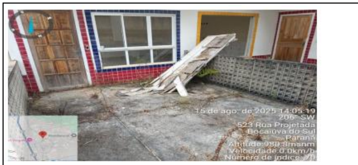
Piso em concreto com rachaduras e vegetação invasoras.