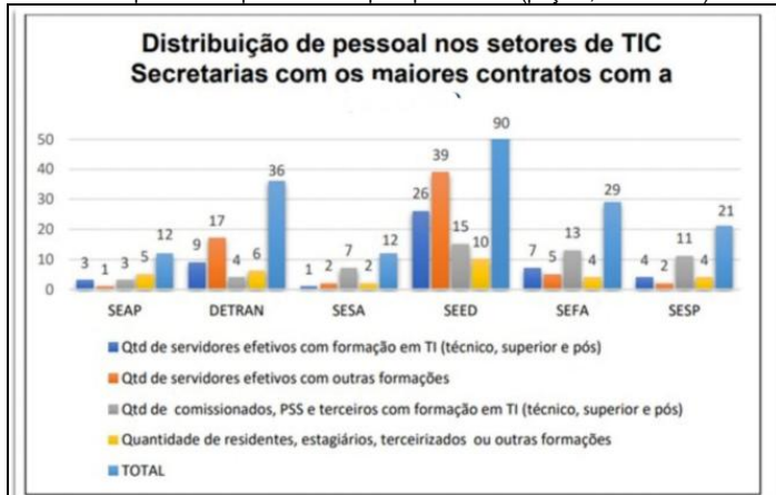
Gráfico 1 - Distribuição de pessoal nos setores de TIC das Secretarias com os maiores contratos com a CELEPAR.

O segundo aspecto do primeiro achado é relativo à não conclusão, previamente à privatização, de estrutura técnica mínima de pessoal e de organização das secretarias. Na decisão que se pretende revogar, foi apontada a existência de dados que revelam uma defasagem de pessoal técnico efetivo nas diversas secretarias do Estado, principalmente naquelas detentoras dos maiores contratos com a C.T.I.C.P., conforme os quadros lá apontados e aqui reproduzidos (peça 5, fls. 24 e 25):