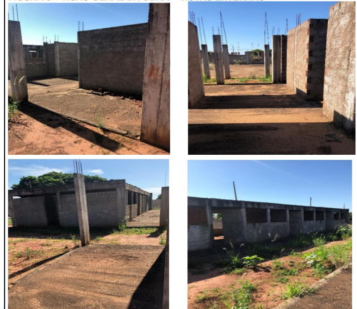
FIGURA 5 – VISÃO GERAL DA OBRA – VISTAS EXTERNAS

Apesar disso, conforme se verifica no Portal Informação para Todos (PIT), após a paralisação da obra, foram licitadas e iniciadas pelo menos quatorze obras, quando deveria ser priorizada a conclusão da construção, sobretudo em face dos benefícios que traria aos municípios.