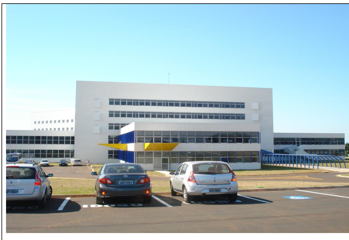
Foto 38 – Vista da fachada principal do Hospital Regional de Ponta Grossa - 19 de abril de 2010.