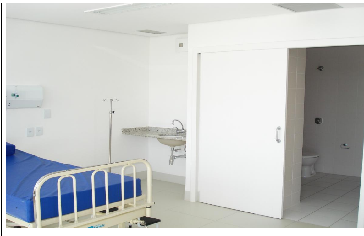
Foto 42 – Interior de quarto para internamento do Hospital Regional de Ponta Grossa – 19 de abril de 2010.