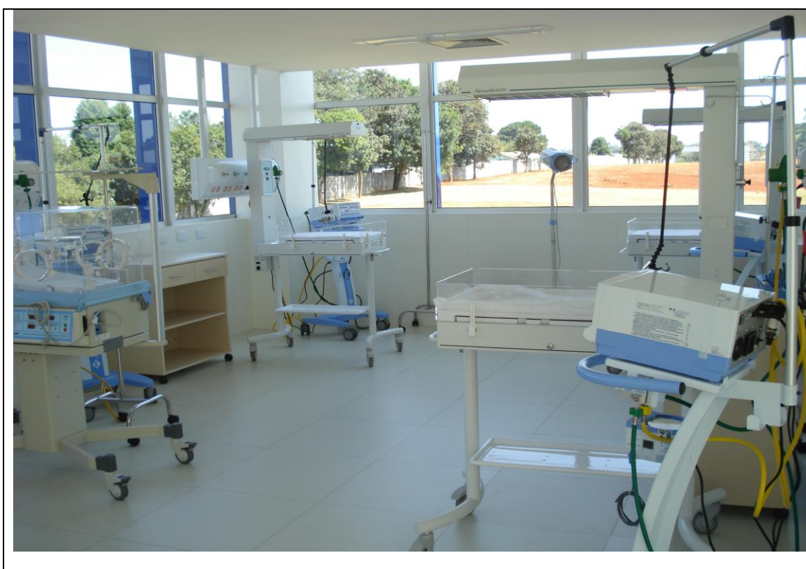
Foto 40 – Equipamentos instalados na UTI Neonatal do Hospital Regional de Ponta Grossa - 19 de abril de 2010.