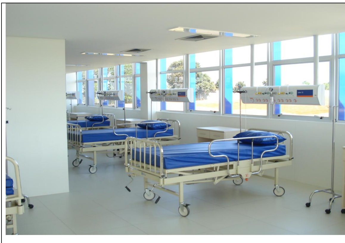
Foto 41 – Equipamentos instalados na UTI Adulta do Hospital Regional de Ponta Grossa - 19 de abril de 2010. (Fonte: CEA-TC).