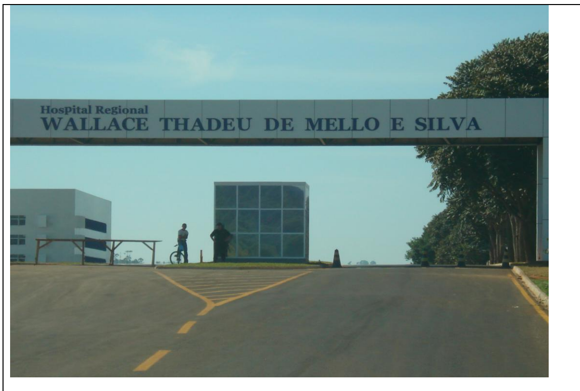
Foto 37 – Entrada do Hospital Regional de Ponta Grossa – 19 de abril de 2010.