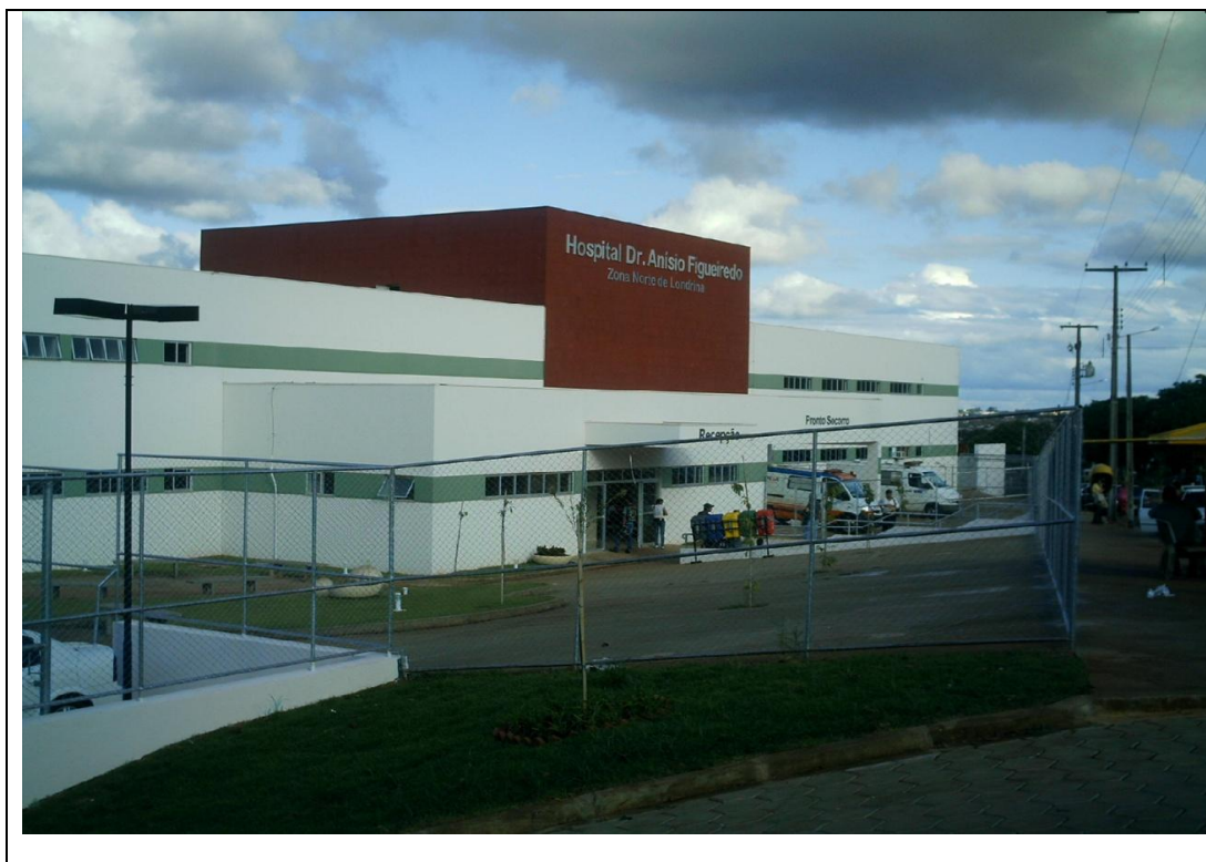
Foto 19 – Entrada Principal do Hospital Zona Norte: Londrina – 29 de abril de 2010.