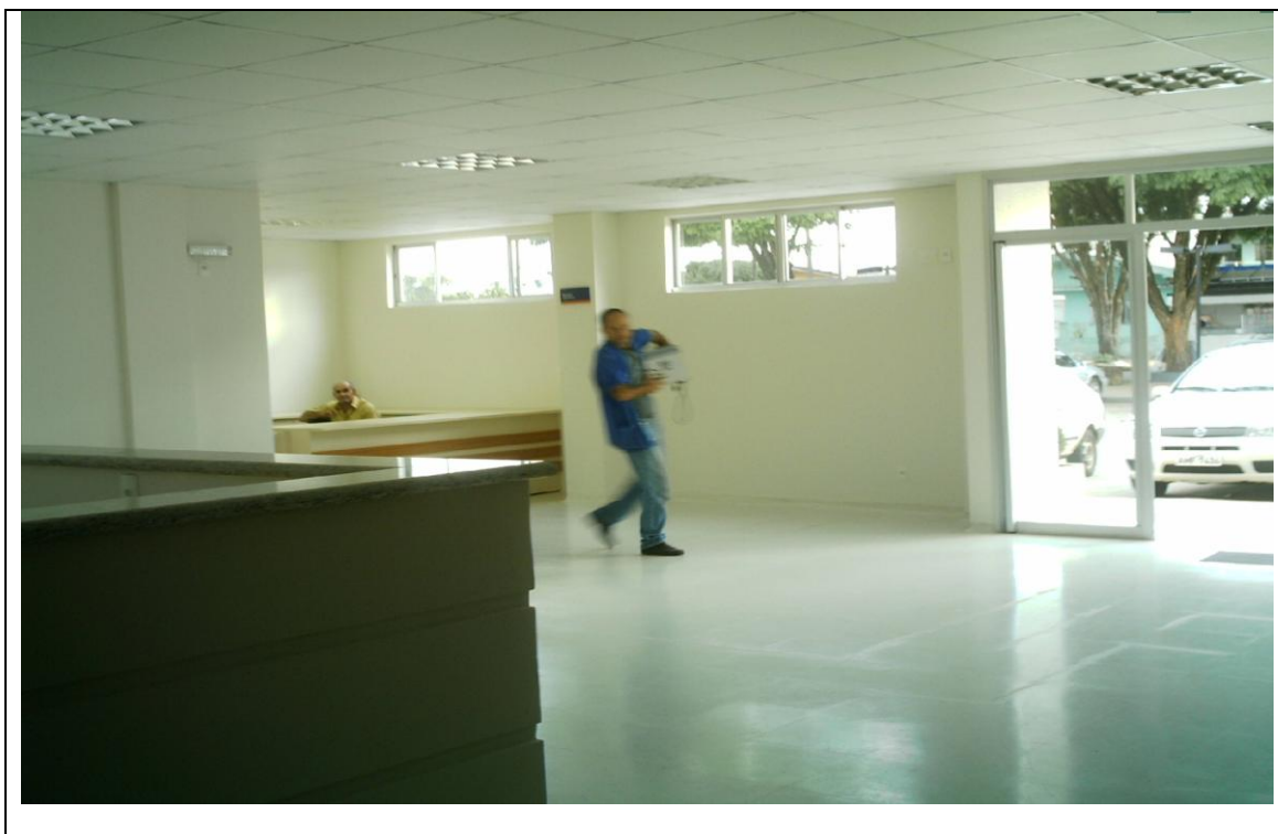
Foto 23 – Recepção do Hospital Zona Sul – Londrina. Ausência de porteiro, recepcionista e secretária para atendimento ao público – 4 de maio de 2010.