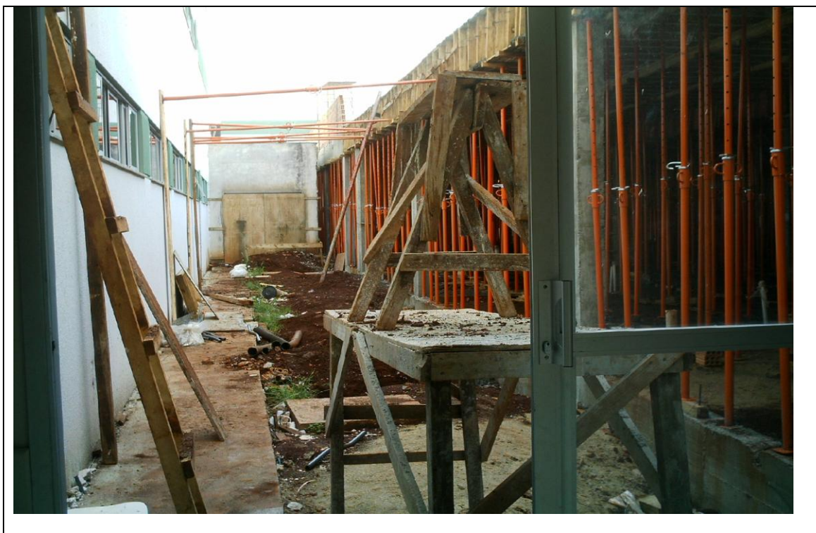
Foto 21 – Relicitação da Obra de Reforma e Ampliação no Hospital Zona Norte: Londrina. Área para novos leitos – 29 de abril de 2010.