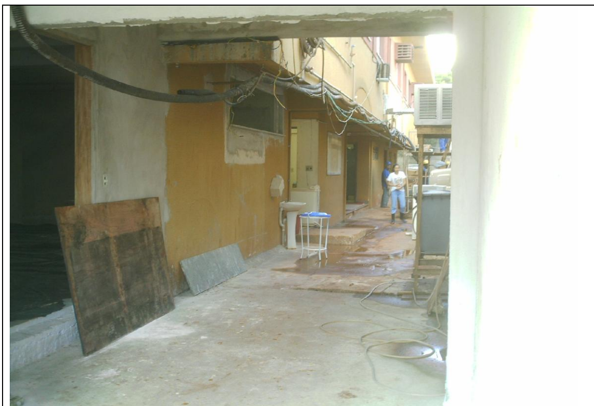
Foto 20 – Relicitação para Obra de Reforma e Ampliação no Hospital. À esquerda acesso a área administrativa do Hospital Zona Norte : Londrina – 29 de abril de 2010.