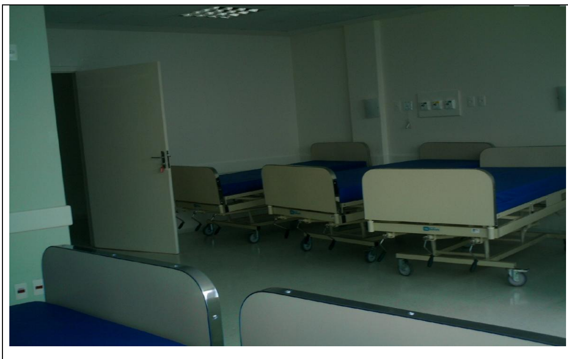
Foto 24 – Quarto para internamentos do Hospital Zona Sul - Londrina, aguardando instalação de equipamentos e contratação de recursos humanos para pleno funcionamento – 4 de maio de 2010.