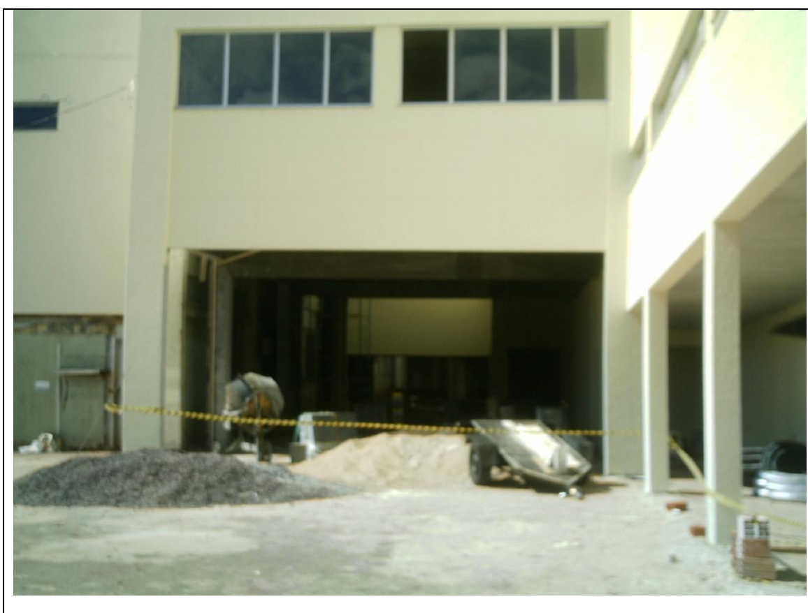
Foto 36 – Construção do Centro de Imagem no Hospital Universitário do Oeste do Paraná – 6 de maio de 2010.