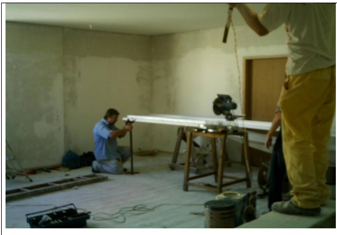
Foto 34 – Reformas na ante-sala do Cento Cirúrgico no Hospital Universitário do Oeste do Paraná – 6 de maio de 2010.