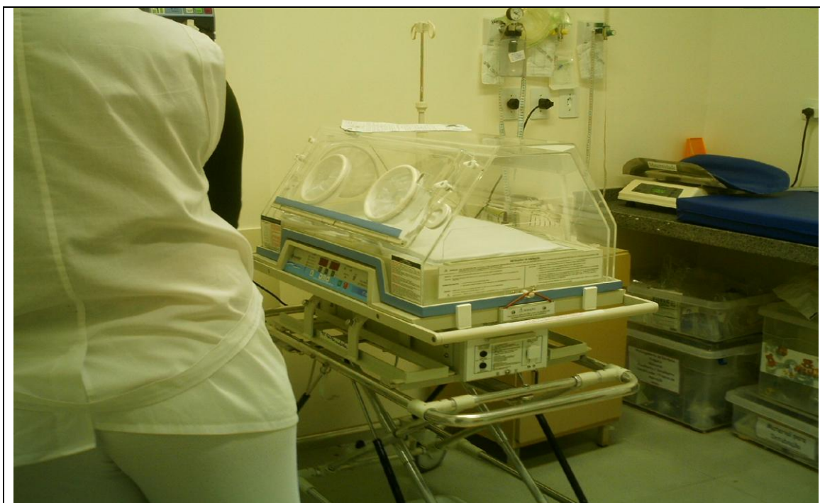
Foto 35 –Equipamentos e instalações para atendimento pediátrico no Hospital Universitário do Oeste do Paraná – 6 de maio de 2010.