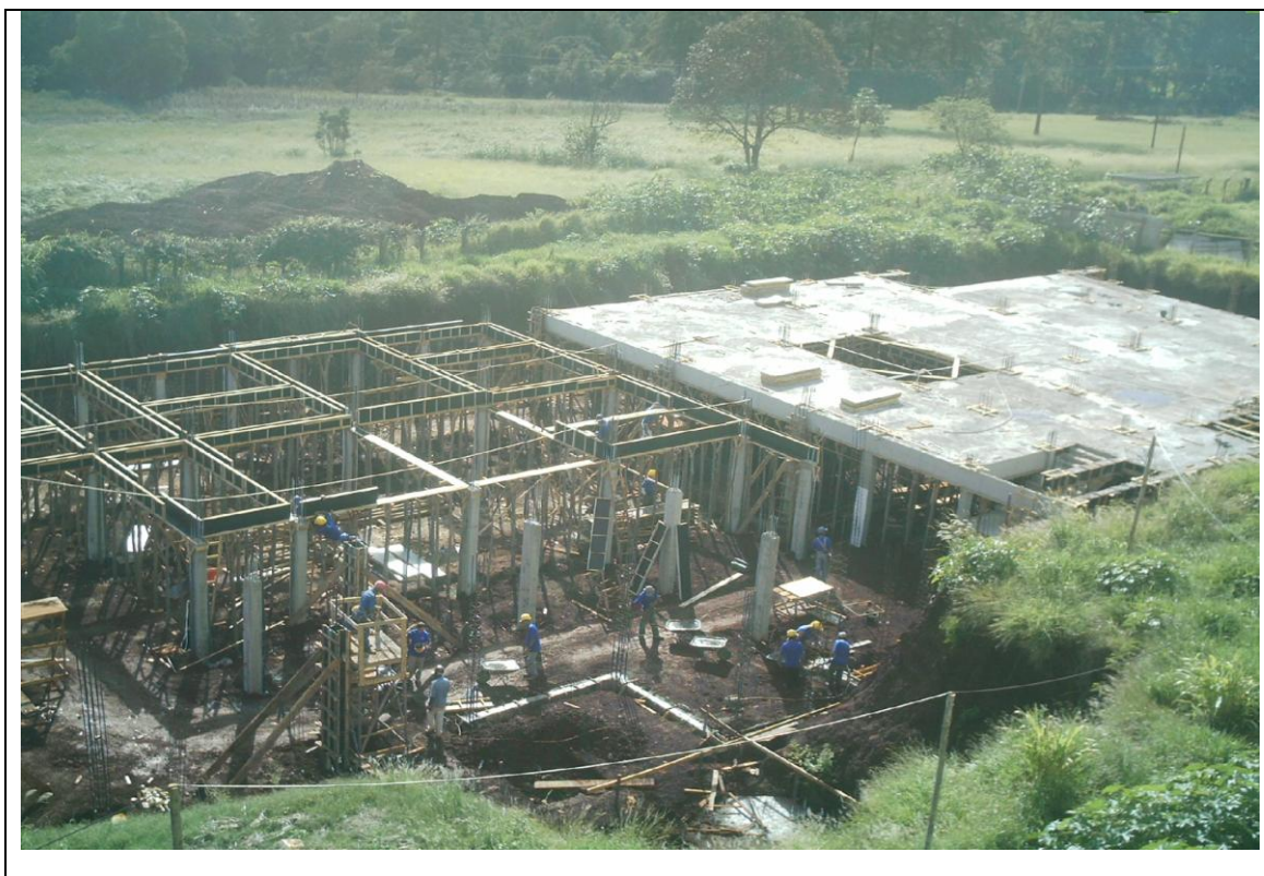
Foto 33 – Construção para instalação dos cursos de Odontologia, Fisioterapia, Enfermagem e procedimentos para correção em Fissura Palatar no Hospital Universitário do Oeste do Paraná – 6 de maio de 2010.