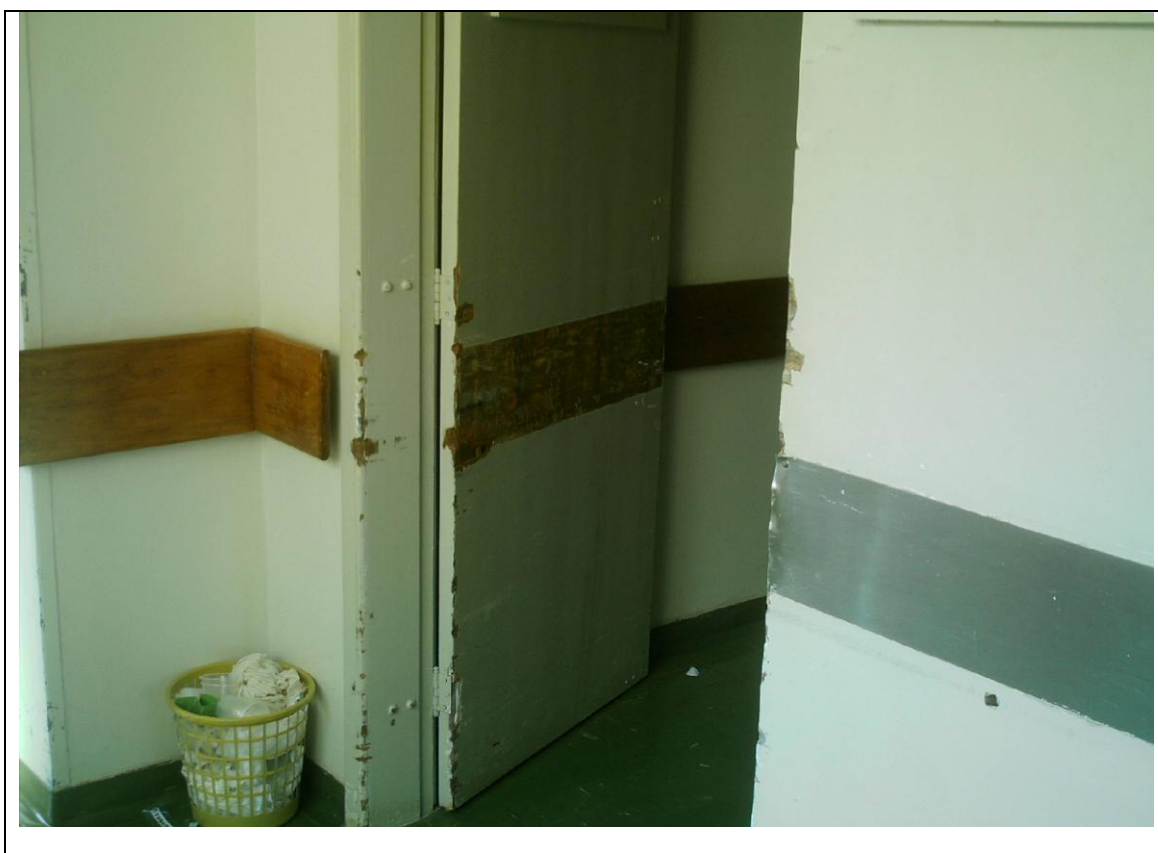
Foto 30 – Situação das dependências do Hospital Universitário do Oeste do Paraná – 6 de maio de 2010.