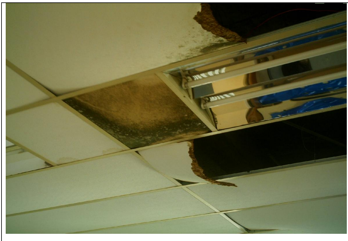
Foto 29 – Situação atual do forro no Hospital Universitário do Oeste do Paraná – 6 de maio de 2010.