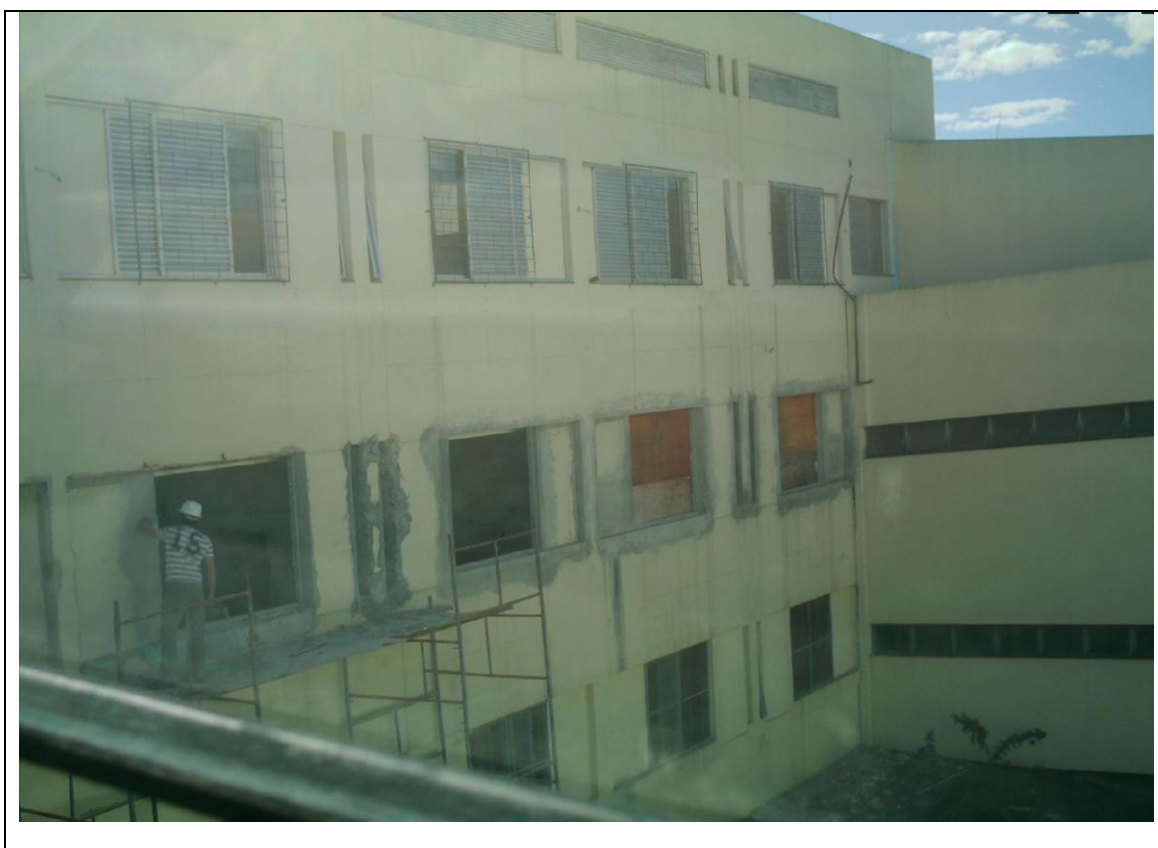
Foto 32 –Substituição nas esquadrias da fachada interna do Hospital Universitário do Oeste do Paraná – 6 de maio de 2010.