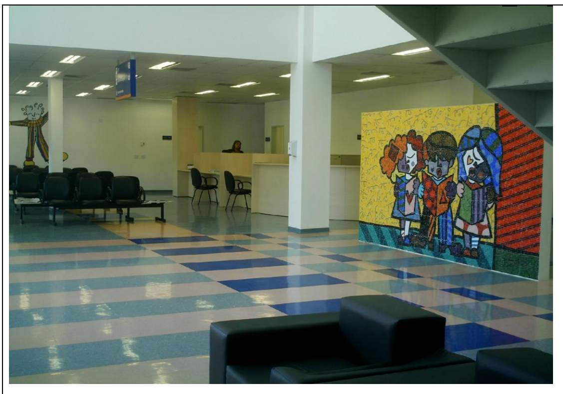
Foto 2 – Hall de entrada em direção a Área Administrativa do Hospital Infantil de Campo Largo – 20 de abril de 2010.