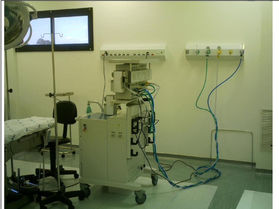
Foto 3 – 1ª. Fase da implantação de equipamentos: Centro Cirúrgico do Hospital Infantil de Campo Largo – 20 de abril de 2010.