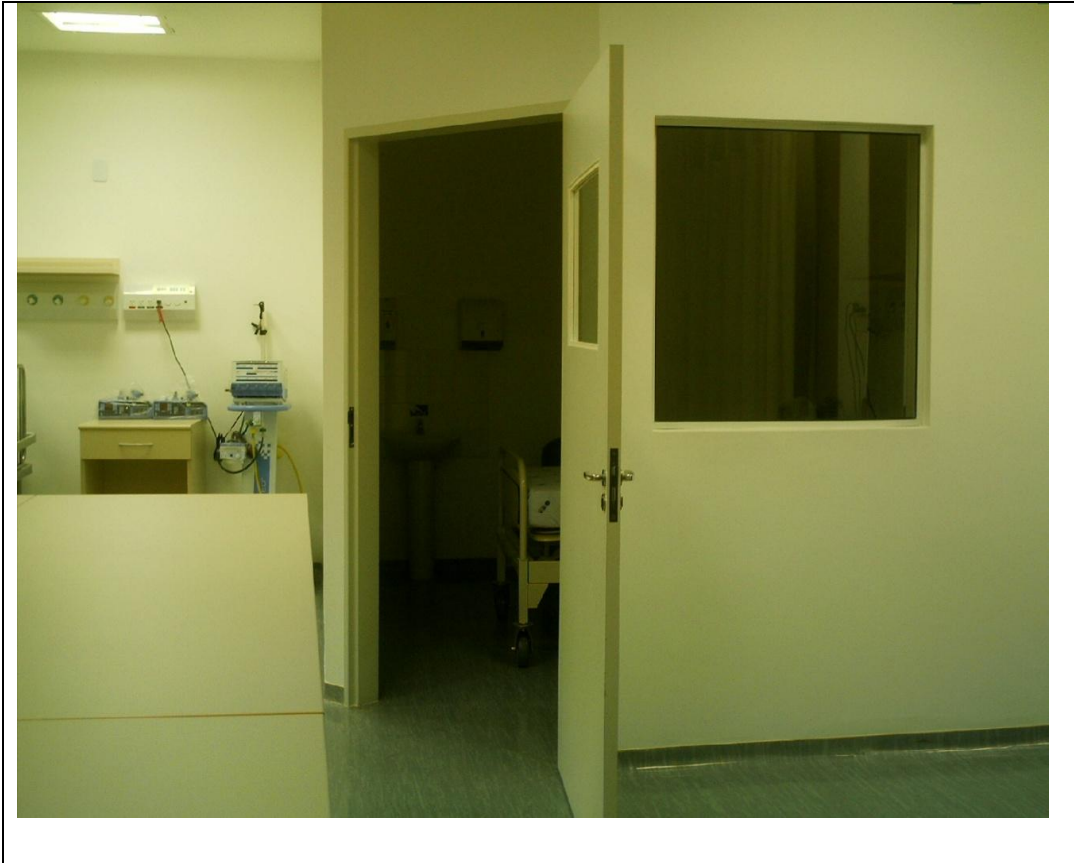
Foto 5 – UTI do Hospital Infantil de Campo Largo sem antecâmara na sala para isolamento - 20 de abril de 2010.