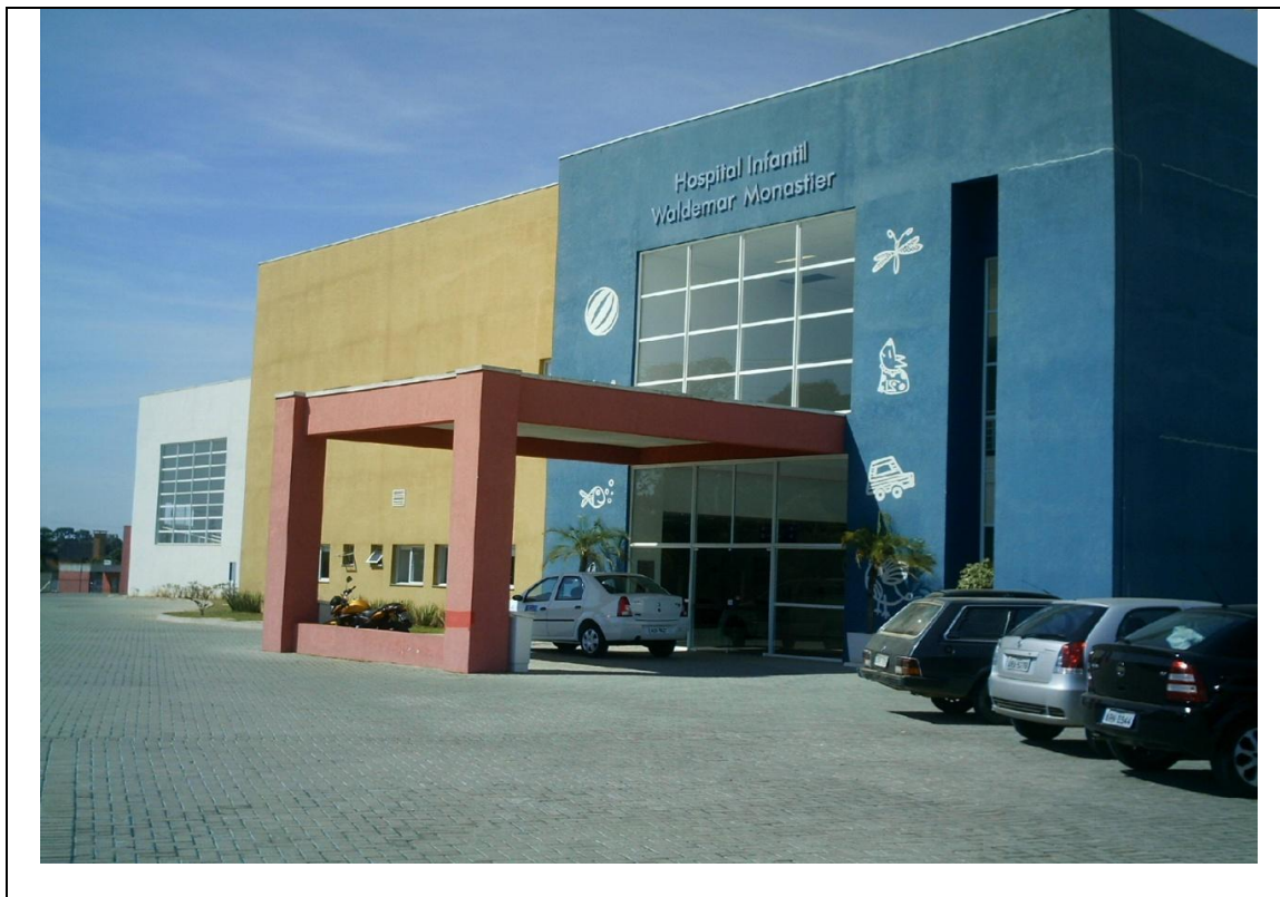
Foto 1 – Entrada Principal do Hospital Infantil de Campo Largo – 20 de abril de 2010.